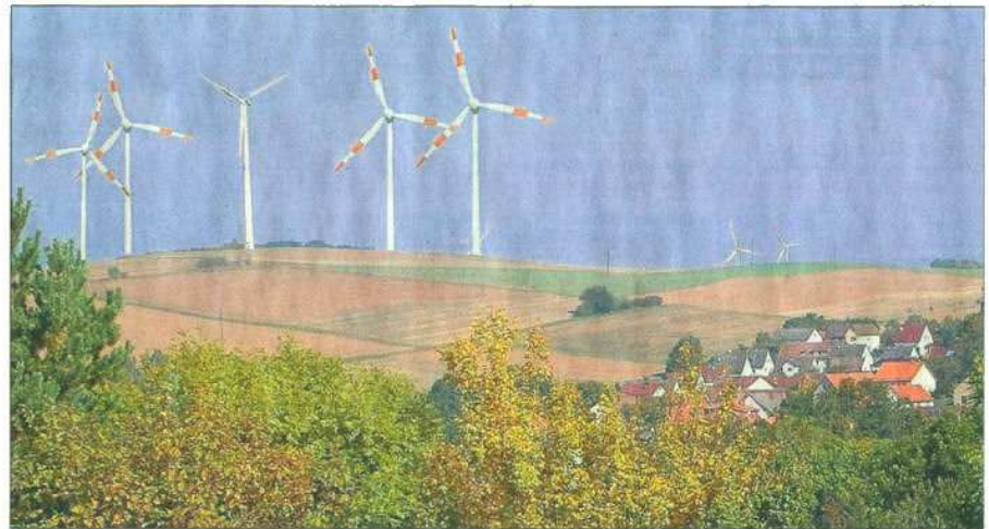
Blick über Dens in Richtung Solz: So hätte es ausgesehen, wenn die Windräder bei Dens gebaut worden wären. Die Fotomontage zeigt links die auf dem Armesberg bei Dens geplanten Windräder, die aber nicht gebaut werden dürfen. Rechts hinten sind die Windräder von Solz zu erkennen, die dort seit vielen Jahren stehen. Der Bereich ist nicht nur Lebensraum für den Rotmilan, sondern wird auch als zentrale Flugroute von Tausenden Kranichen genutzt.

17.12.2013: Der Hessische Verwaltungsgerichtshof lehnt in letzter Instanz die Zulassung der von eolica beantragten Berufung gegen das Urteil des Verwaltungsgerichts ab. (dup)